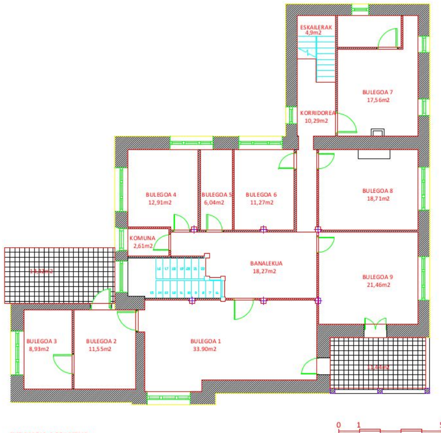
AVE MARIA 1 SOLAIRUA